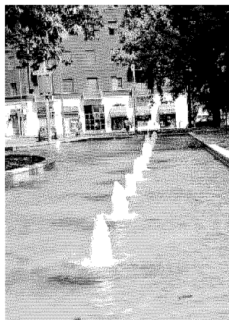
Piazza Tirana, al Giambellino

Oltre alla vendita di fette di anguria, che potranno essere mangiate seduti a una serie di tavolini all'